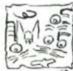
De la Cité d'Angers

Association des Amis des Pères Blancs BP 52354 - 49023 ANGERS cedex 02