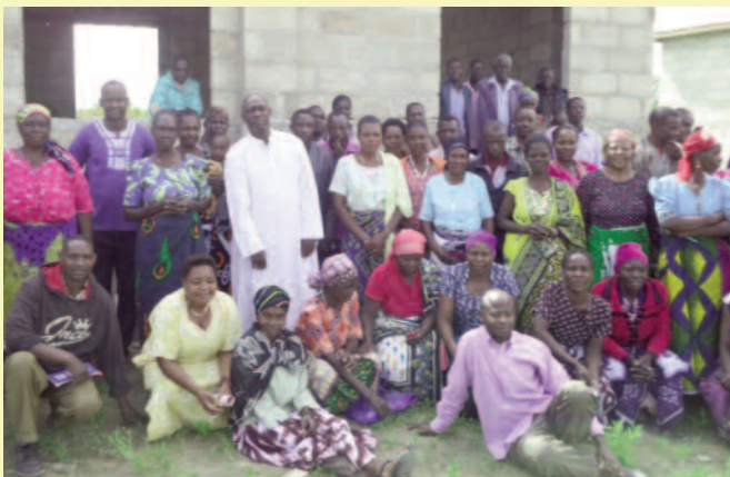
Le groupe pose avec fierté devant l'une des salles