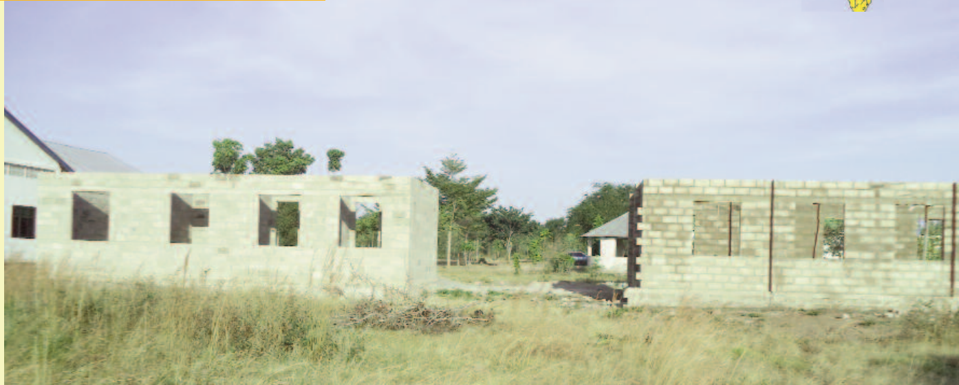
La Fédération des AAPB a contribué à la construction de deux salles dans une paroisse de Tanzanie.