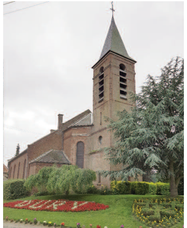
Eglise de Dury