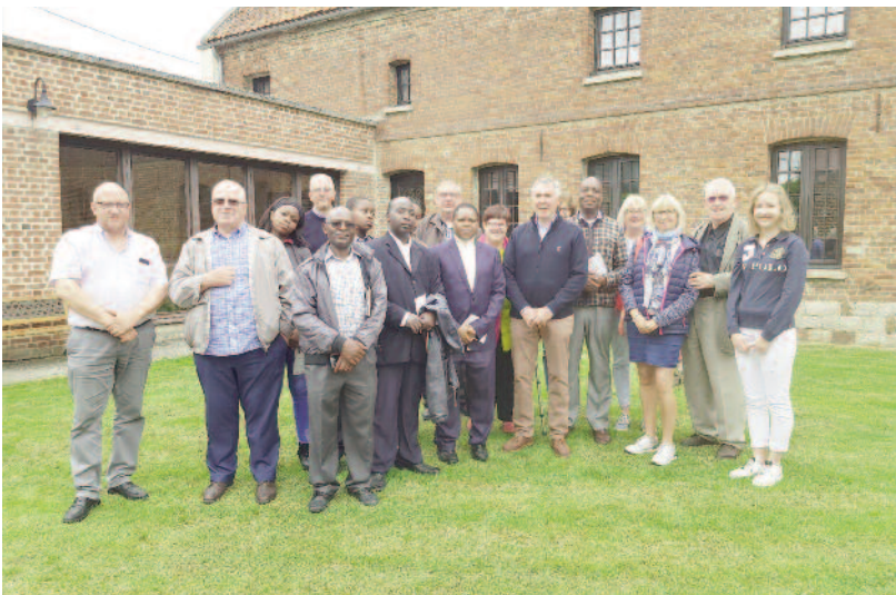
Devant la maison natale du Père Lourdel